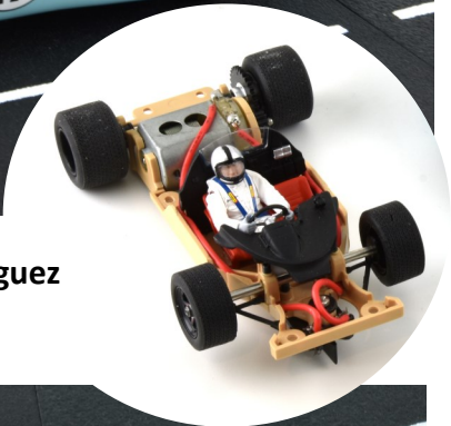
n°17 pilotée par / driven by Pedro Rodriguez