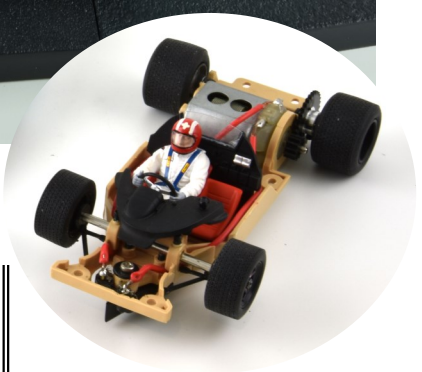
n°18 pilotée par / driven by Jo Siffert