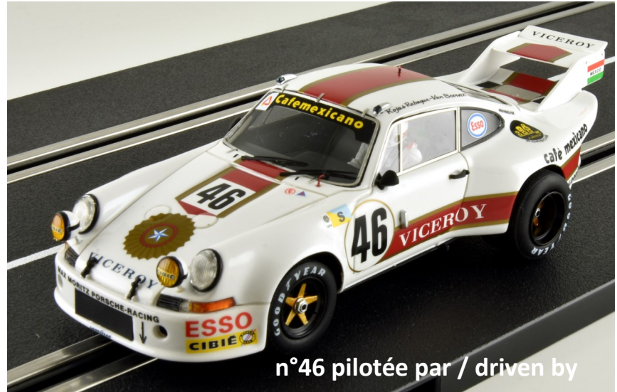
n°46 pilotée par / driven by