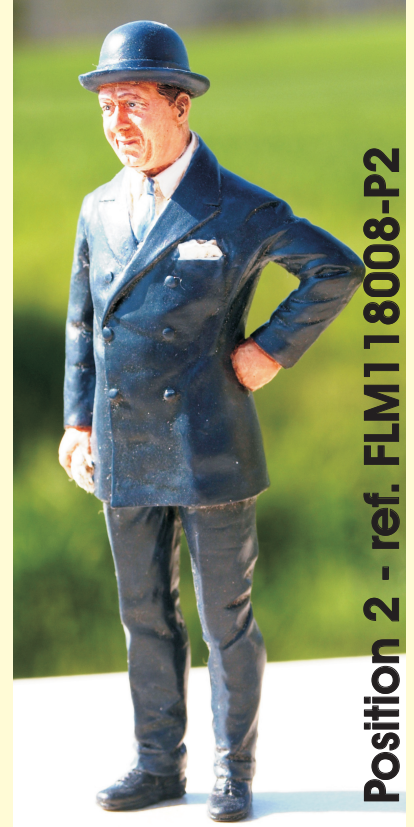
Position 2 - ref. FLM118008-P2