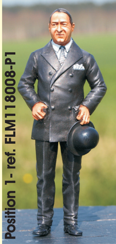
Position 1 - ref. FLM118008-P1

Il décède le 21 août 1947 des suites d'une congestion cérébrale. Sa mort et les difficultés économiques de l'après-guerre auront raison de l'usine et de la marque.