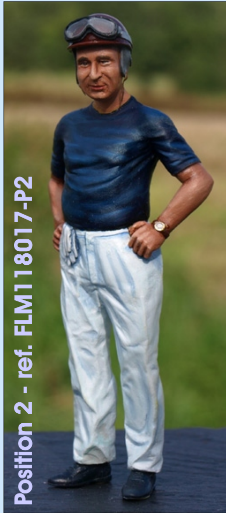
Position 2 - ref. FLM118017-P2