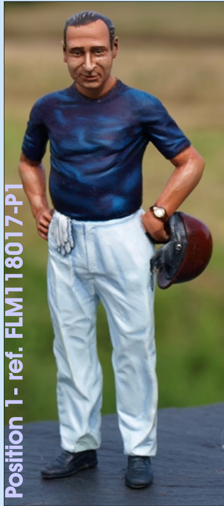
Position 1 - ref. FLM118017-P1