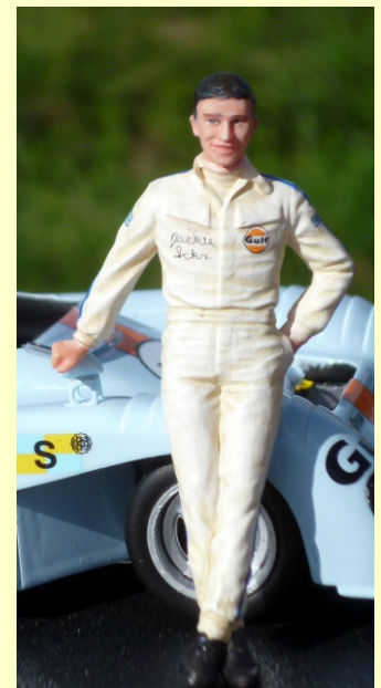
Jacky Ickx 1969 FLM132020

Boîte de présentation Presentation box 8x5.6x3.2 cm