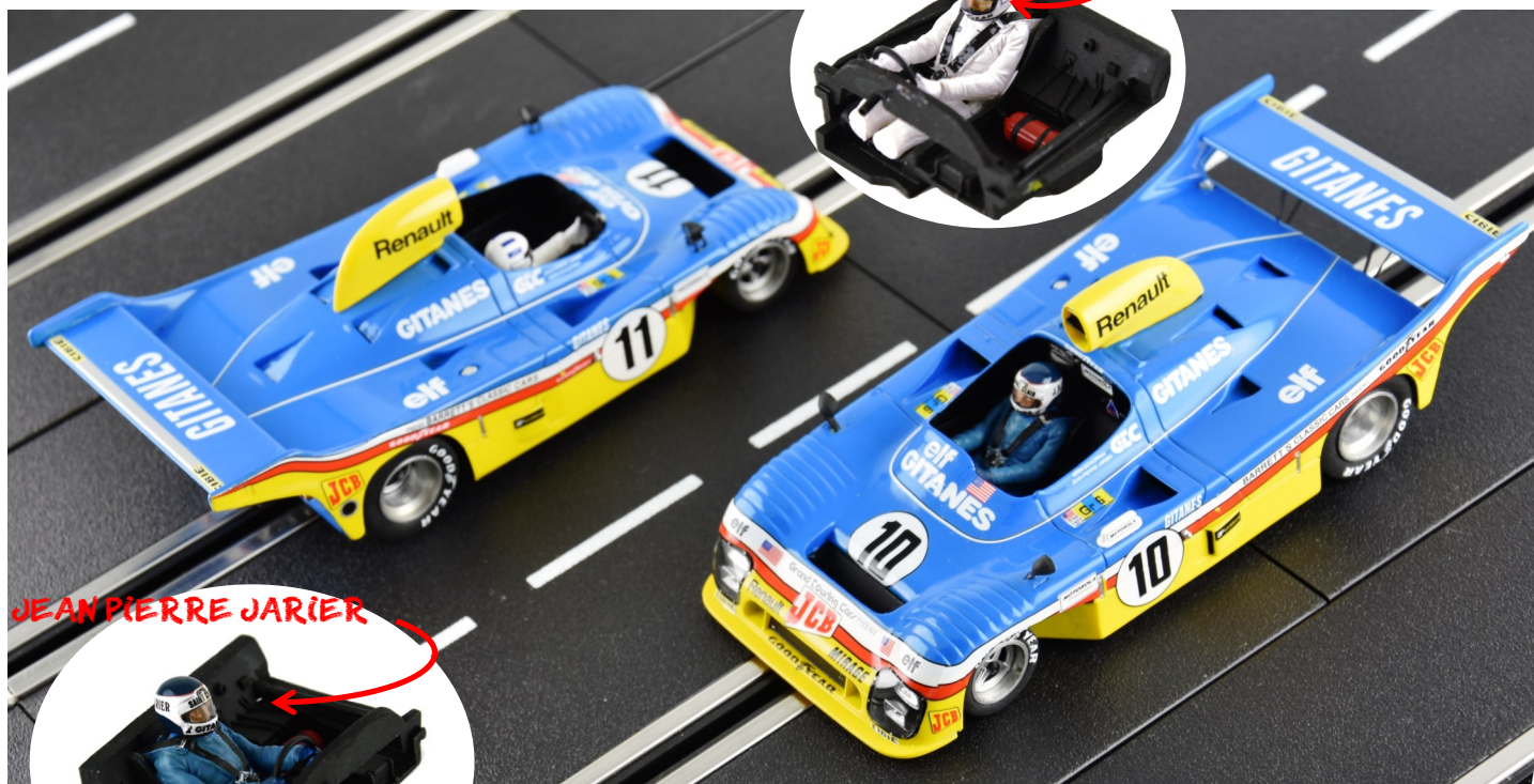
n°10 : Vern Schuppan & Jean-Pierre Jarier 2ème place / 2nd place