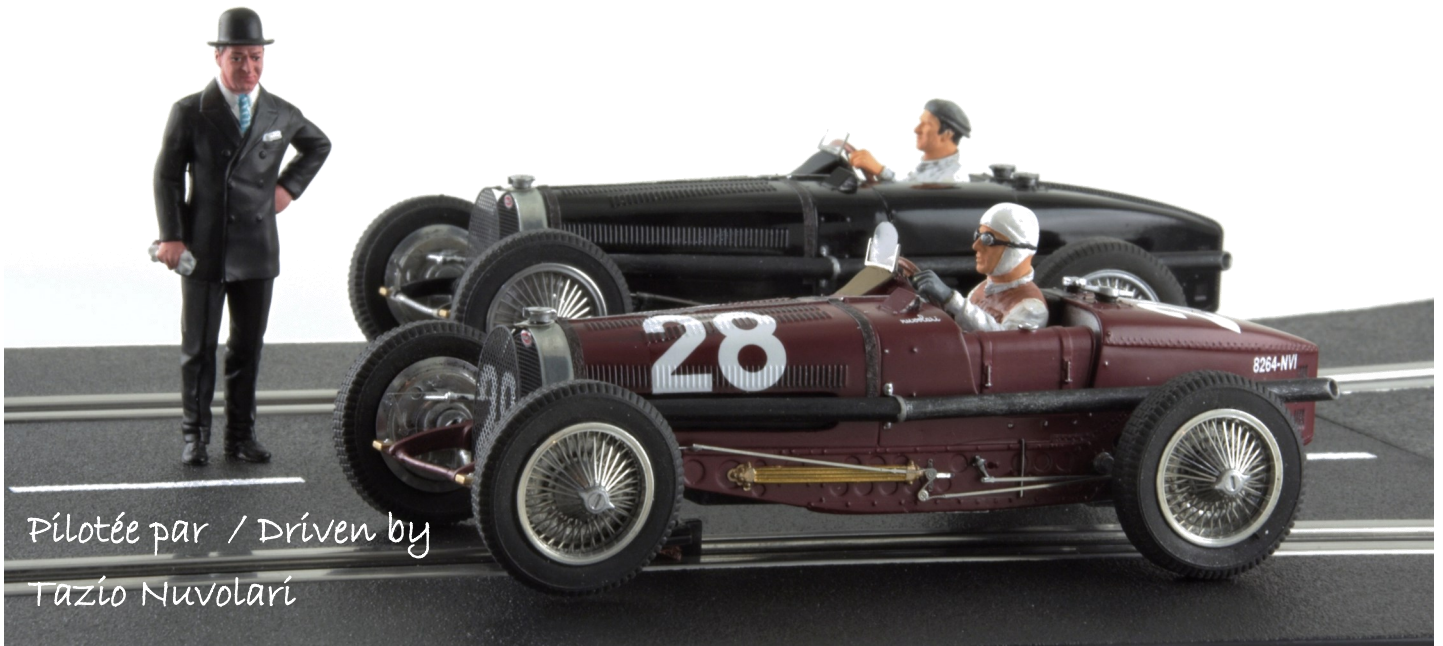
Pilotée par / Driven by Tazio Nuvolari