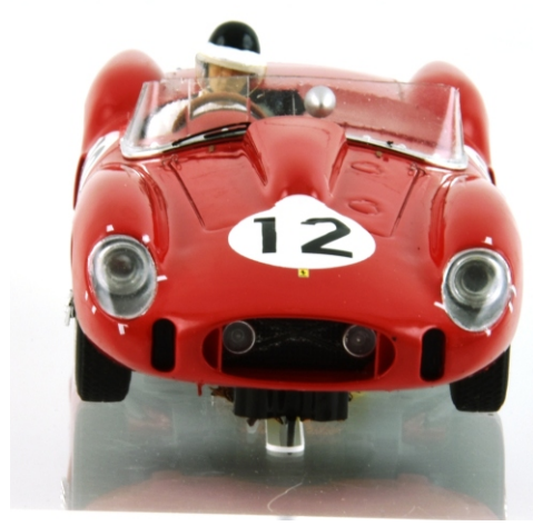
Wolfgang von Trips