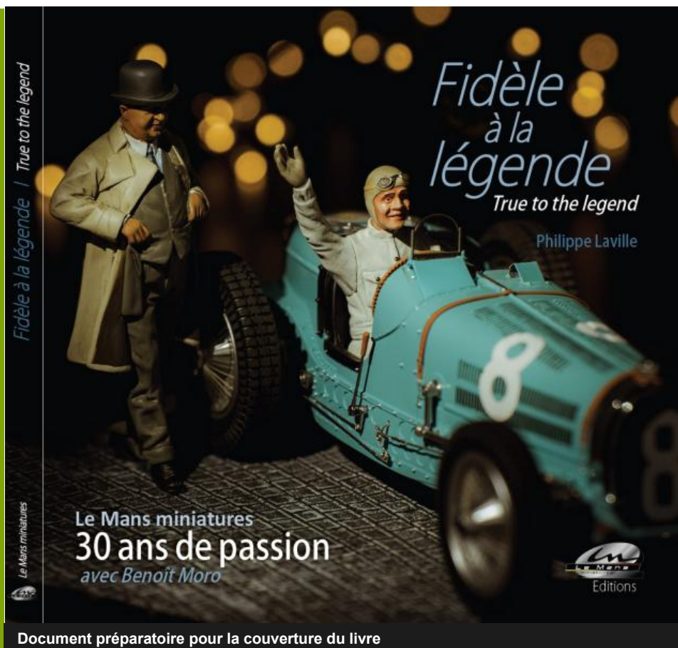
Document préparatoire pour la couverture du livre